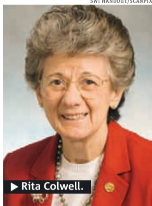
► Rita Colwell.

PRISAD. Forskaren Rita Colwell, 76, får årets Stockholm Water Prize. Hon belönas för arbetet med att hindra spridningen av vattenburna infektionssjukdomar, särskilt kolera som leder till omkring 120 000 dödsfall varje år. Hon var först att med hjälp av satellitbilder spåra och förutse kolerautbrott. ● METRO