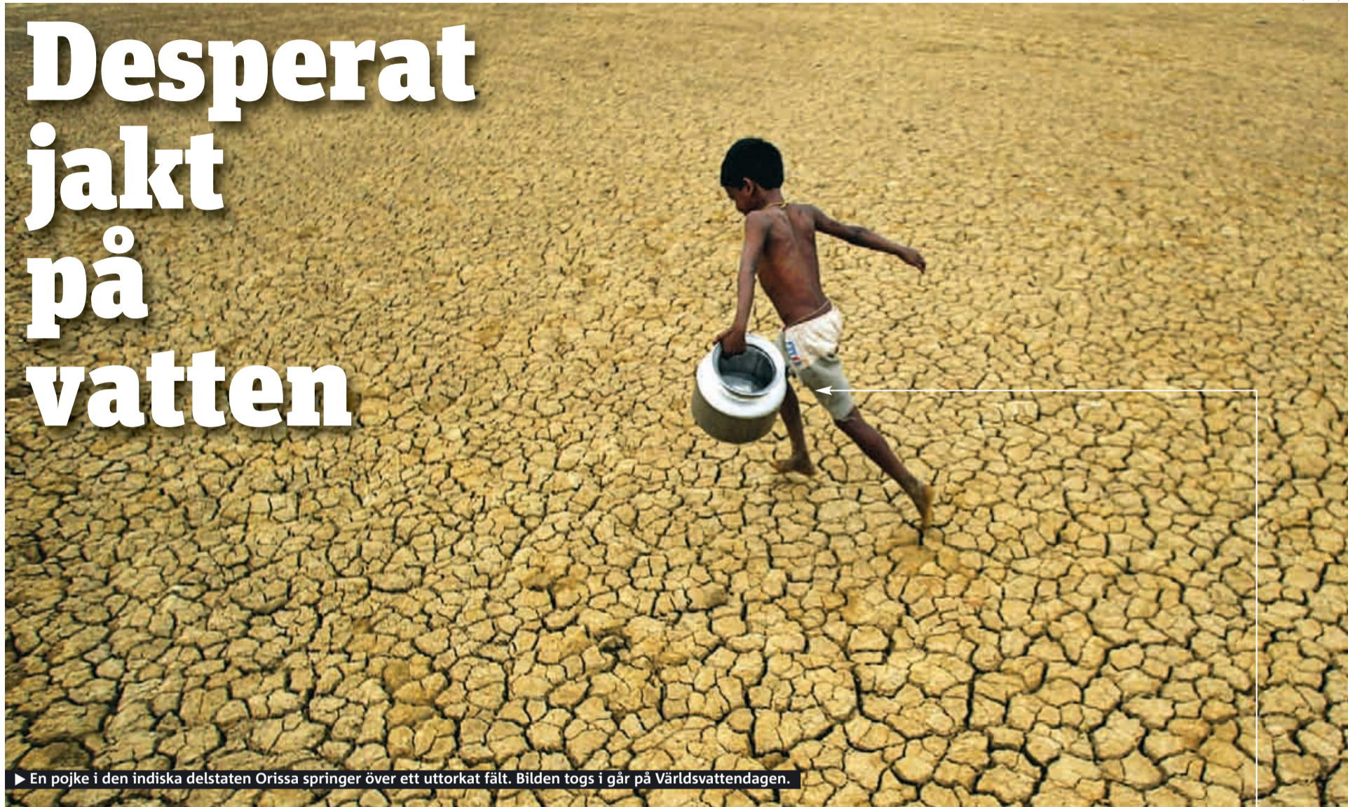
► En pojke i den indiska delstaten Orissa springer över ett uttorkat fält. Bilden togs i går på Världsvattendagen.