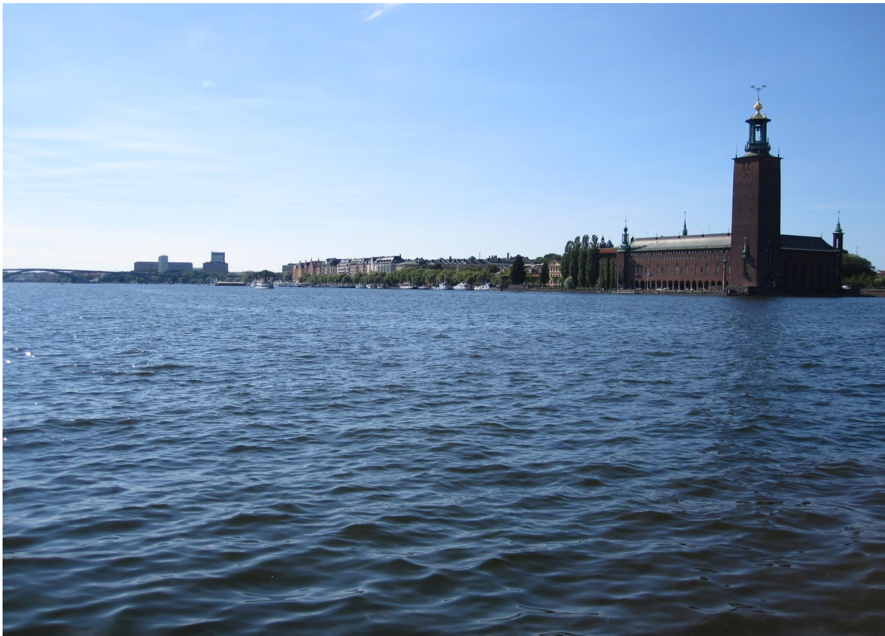
Vattenpaketet (SHR)