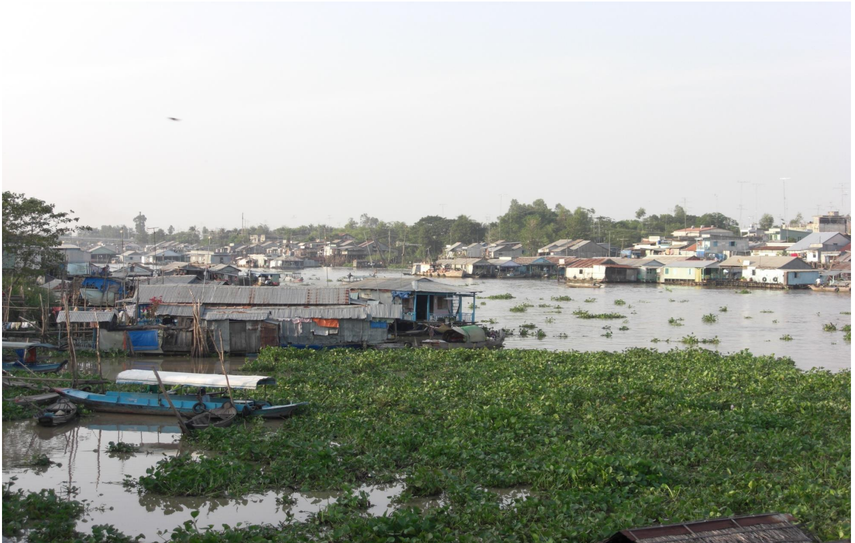
Vattenpaketet (SHR)